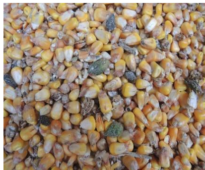
Maïs contaminé (sicyos en vert)