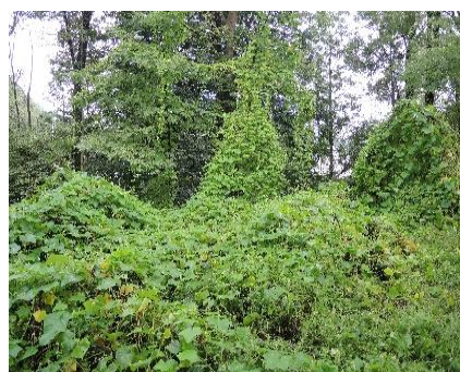
Port grimpant