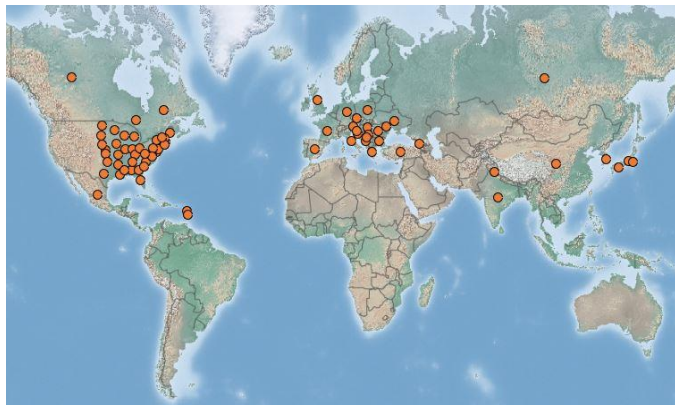
Distribution mondiale de Sicyos angulatus ( https://www.cabi.org/isc/datasheet/49978 )

Lien vers la carte de distribution Info Flora