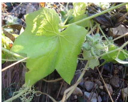
Feuille, fruit et vrilles