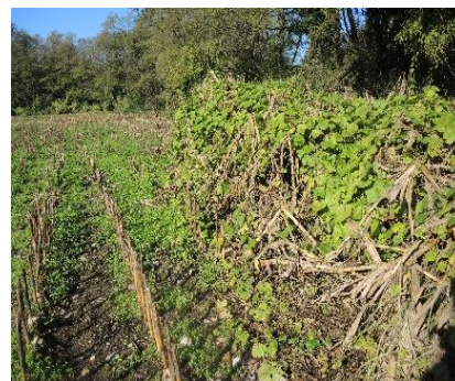
Récolte du maïs