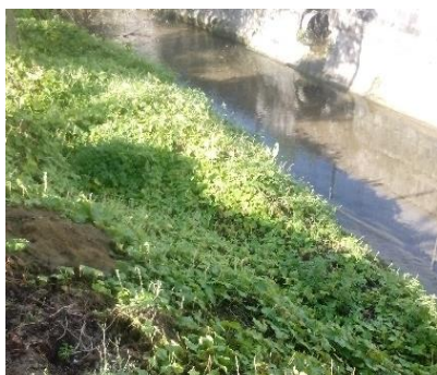
Berge d'un cours d'eau envahi

Son expansion le long des cours d'eau est rapide puisqu'il affectionne les ripisylves et qu'il atteint ces dernières grâce à la dispersion de ses graines par l'eau courante. Les fortes pluies à l'origine d'inondations et d'une érosion des sols accélèrent la dispersion des graines.