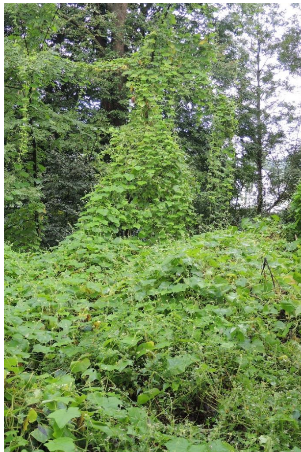
Sicyos angulatus